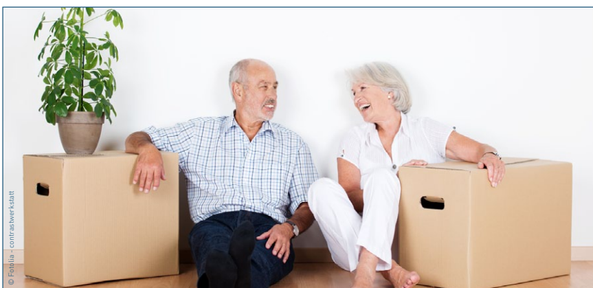
Brisante Idee: Rentner zum Umzug bewegen, um jungen Familien Wohnraum zur Verfügung zu stellen.

Die Förderung von Arbeitsplätzen in entspannten Wohnungsmärkten würde viele Probleme besser lösen als der mit Steuergeldern subventionierte Versuch, noch mehr Menschen in den Ballungsgebieten anzusiedeln. Die Förderung von Ballungsgebieten unterstützt den weiteren Abwanderungsprozess von Menschen aus strukturschwachen Regionen und schafft eben Probleme sowohl in den Ballungsgebieten als auch in den Leerstandgebieten. Diese Fehlentwicklung mit Druck auf einzelne Mietergruppen korrigieren zu wollen, ist ohnehin keine Lösung und würde auch nicht funktionieren.