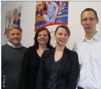
Das Initiatorenteam von PiA e. V., ifak e. V. und dem Beratungszentrum Halberstadt