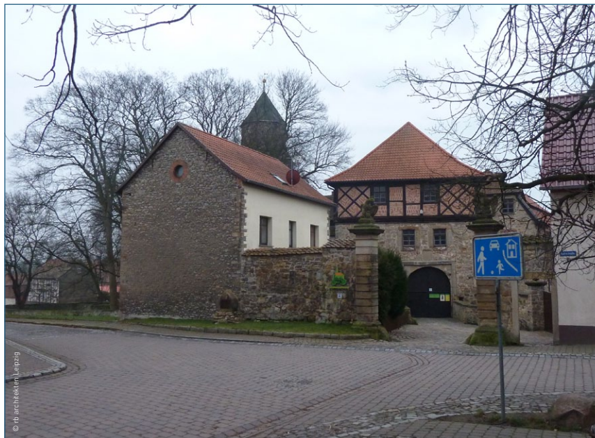
Das multiple Haus als neue Dorfmitte: Blick auf die Burg in Ummendorf.

In einem ersten beispielgebenden Modellprojekt wurden fünf Dörfer am Stettiner Haff vom Büro rb architekten bei der Aktivierung multipler Häuser und der Umsetzung eines ersten regionalen „Netzwerks Daseinsvorsorge“ begleitet und dieser Prozess entsprechend dokumentiert. Alle fünf Häuser wurden 2014 eröffnet. Weitere Regionen haben Bedarf an multiplen Häusern angemeldet, sodass sich inzwischen ein überregionales Netzwerk entwickelt hat.